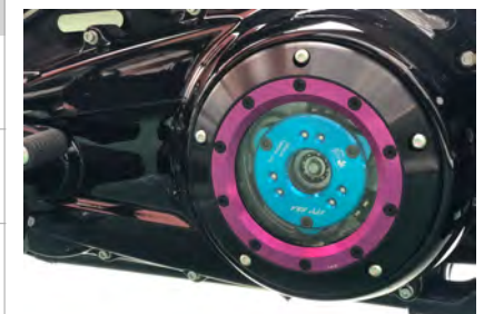
例) ブラック&パープル *VPCは付属しません。