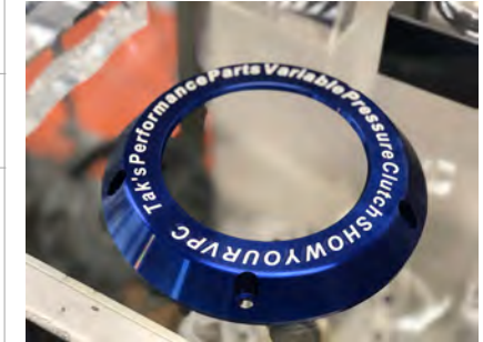
例) ブルー&名入れ *クロームメッキとパウダーコートへの文字入れはできません。