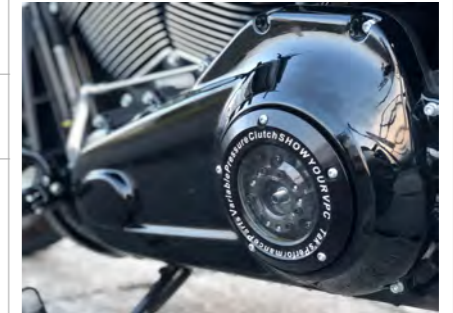
例) ブラック&文字入れ *VPCは付属しません。