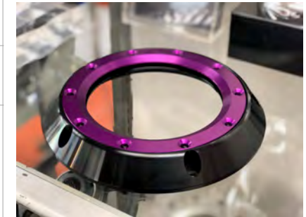
例) ブラック & パープル