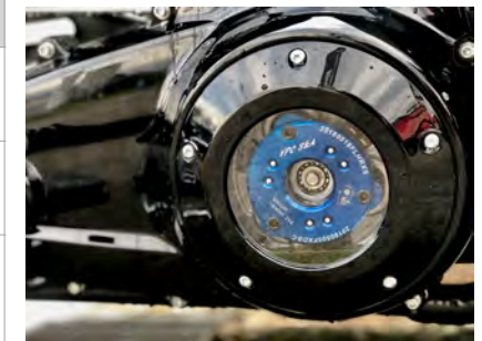
例) ブラック *VPCは付属しません。